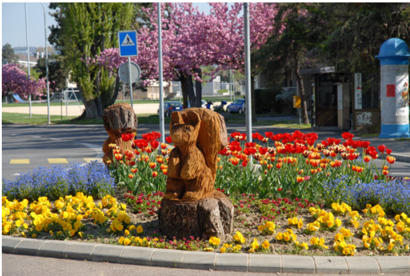
Photos du stand communal à l'exposition Flores 2011