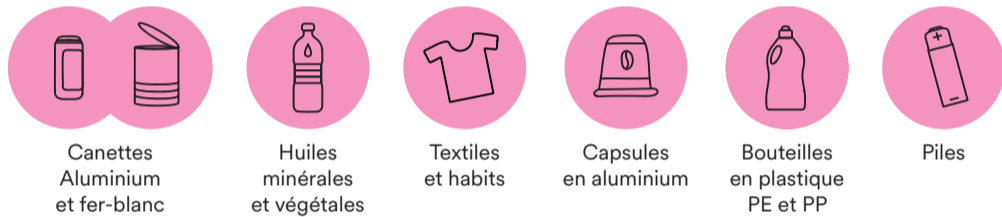
Canettes Aluminium et fer-blanc