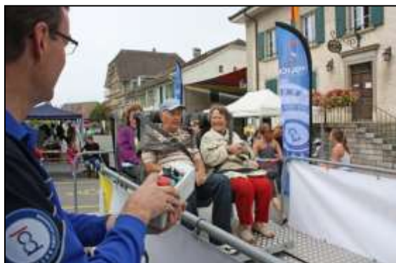
Cap sur l'Ouest à Ecublens, le 23 septembre 2012

Les actions menées en 2012 dans le domaine de la circulation routière ont été les suivantes: « En forme pour la conduite » (alcool au volant); « Attaché à la vie » (port de la ceinture de sécurité); « Slow Down » (contrôle de circulation avec Franky); « Dans un giratoire ... indiquez votre sortie »; « Passage pour piétons » (respect des uns et des autres lors de la traversée de la route) « Passeport vacances » (jardin de circulation); « Merci de t'arrêter pour moi » (rentrée scolaire); « Semaine de la mobilité » (stand POL sur la place du Motty sur le thème de la ceinture de sécurité); « Lumière, visibilité, sécurité » (rappel sur l'importance d'être visible dans la circulation).