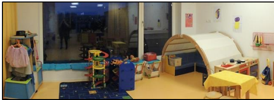
Serge Nicod Chef du service des affaires sociales et de la petite enfance

« Les Mouflets » accueillent les enfants dès l'âge de 2 ½ ans jusqu'à l'entrée à l'école enfantine, à raison de 2 demi-journées par semaine et 3 uniquement l'année avant l'école enfantine.