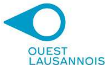
Schéma directeur de l'Ouest lausannois (SDOL)

Bussigny-près-Lausanne, Chavannes-près-Renens, Crissier, Ecublens, Lausanne, Prilly, Renens, Saint-Sulpice, Villars-Sainte-Croix, État de Vaud