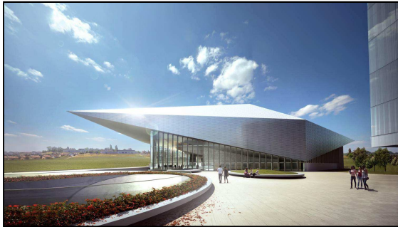
Projet du Swiss Tech Convention Center