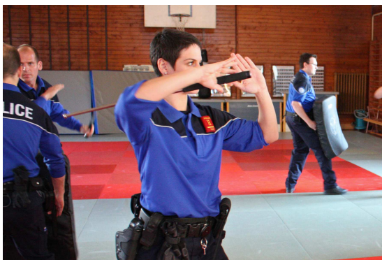
Formation bâton tactique

Enfin, la commission de gestion de l'Association est en charge de la vérification de la gestion de l'Association, tâche qui fait également l'objet de comptes rendus publics sur Internet, à la même adresse.