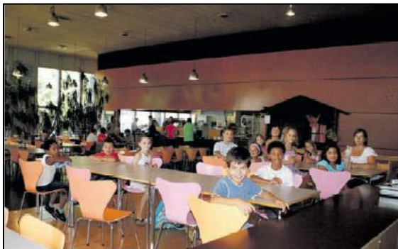
Réfectoire du Croset – restaurant Novae SA – cantine Maillefer

Nous tenons à remercier chaleureusement l'ensemble du personnel de nos réfectoires pour leur fidèle collaboration très professionnelle.