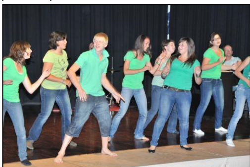
Chant en mouvement