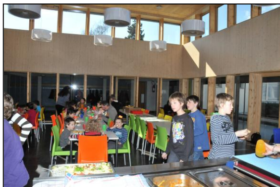
Réfectoire du Pontet

Le réfectoire du Pontet accueille une quarantaine d'enfants dont environ 7 à 9 du collège d'Epenex. Ces derniers sont transportés par notre bus scolaire à l'issue des cours. Une nouvelle personne a été engagée dès le 1 er novembre 2010, Mme Noverraz, pour assurer la surveillance de ces enfants depuis la fin des cours jusqu'à l'arrivée du bus. De plus, cette dernière les