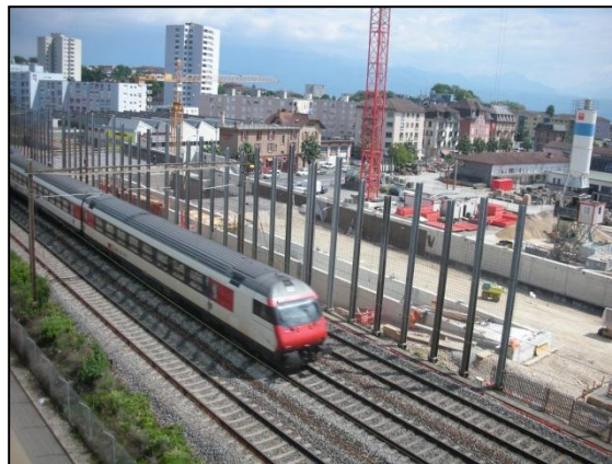
Chantier de la halte RER de Prilly-Malley, juin 2010

concepts d'organisation des espaces publics, de la mobilité et des infrastructures, ainsi qu'une estimation sommaire des coûts.