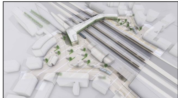
Image de synthèse tirée de l'étude d'avant-projet de la passerelle et des places nord et sud de la gare [Farra & Fazan, Tekhne SA, l'Atelier du Paysage]

En raison de la priorité donnée aux piétons et à leur accès aux transports publics et à cause des risques de conflits et d'accidents qu'engendrerait un autre type de mobilité sur la passerelle, il a fallu admettre que les cyclistes ne pourront pas emprunter cette dernière à vélo. L'accès et le stationnement de vélos à la gare sont garantis, mais le transit nord-sud doit être reporté en dehors du secteur restreint de la gare. Les études pour trouver des solutions à l'est et/ou à l'ouest sont en cours.