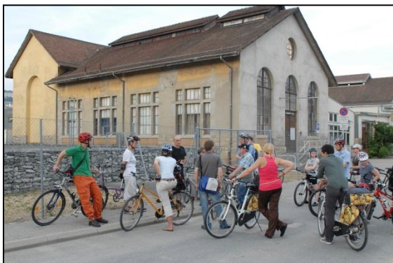
Visite de Malley à vélo dans le cadre de la série les baladeurs

Le bureau du SDOL organise ou participe également à des promenades commentées à pied ou à vélo qui permettent au public de découvrir les développements envisagés dans l'Ouest lausannois. Début juillet 2010, il a ainsi accompagné les "Baladeurs" de la gare de Renens à Malley, en passant par Crissier.