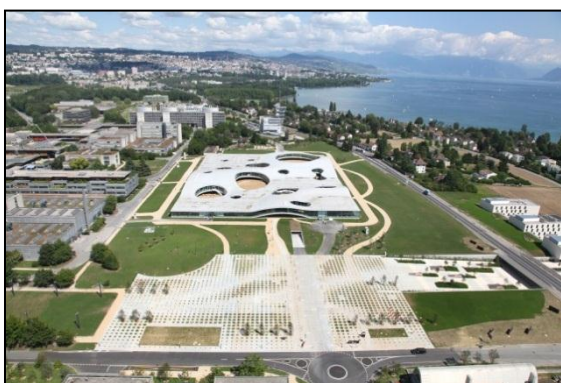
Vue aérienne du campus EPFL 2010 [Alain Herzog]