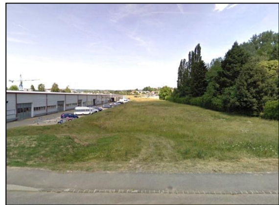
Le secteur de Vallaire et ses terrains à bâtir entre zone industrielle et parc paysager

L'élaboration d'un plan directeur localisé (PDL) intercommunal a été lancée avec la participation de la commune de St-Sulpice et du canton. L'enjeu est d'approfondir et de compléter l'étude publiée en 2006 afin de donner à ces résultats une forme légale pouvant servir de base à la création de plans partiels d'affectation (PPA) ou de plans de quartier. À ce stade, il s'agit de définir des sous-secteurs pour des PPA en précisant leurs vocations et leurs densités, de développer le concept paysager et des espaces publics, d'introduire les données issues des dernières études du PALM et du SDOL, d'adapter aux spécificités du secteur le PPA modèle créé pour le chantier 2 et de mener une analyse foncière et financière.