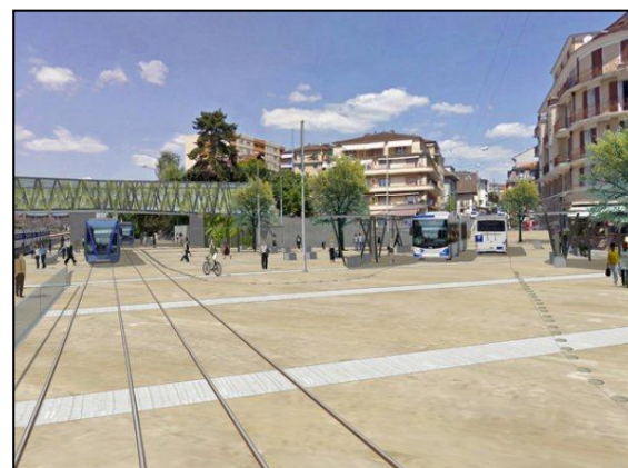
Vue de synthèse du tram sur la place nord de la gare à Renens

Pour donner une vue d'ensemble du projet et de ses articulations, les pages internet du "réseau-t" ( www.lausanne-morges.ch/axes-forts ) ont été créées. Une brochure a également été conçue pour être publiée fin septembre 2010.