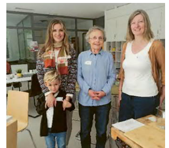
De droite à gauche, les deux bénévoles du café contact et une bénéficiaire avec son enfant.

https://www.ecublens.ch/actualites/4603-conflit-en-ukraine-informations-utiles