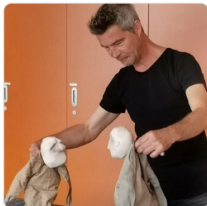
Ouverture officielle de saison et Semaine de la créativité 2023