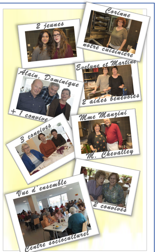
Certaines de ces photos ont été publiées dans le Clic-Clac de 24H du 20 janvier 2015. Et oui, rien que ça!