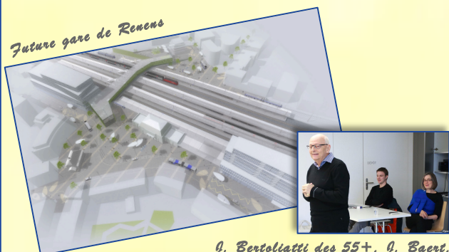
Future gare de Renens