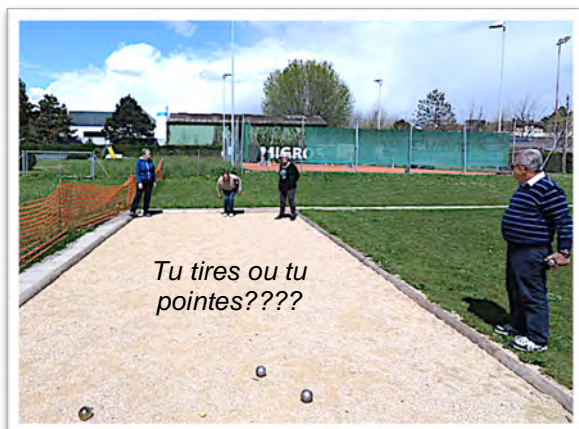
Tu tires ou tu pointes????

N'hésitez pas à nous rejoindre! Nul besoin de s'inscrire. Venez avec vos boules et... votre bonne humeur, à l'heure!