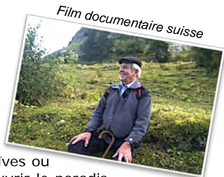
Film documentaire suisse

10 participants se sont rendus au City Club de Pully pour voir ce film. Ce documentaire de Stéphane Goël nous a emmenés non seulement sur des chemins des Préalpes fribourgeoises, mais également sur un cheminement intérieur. Qu'est-ce que le paradis ? Pour chacun d'entre nous la réponse est différente. Naïves ou cartésiennes, les réponses des personnes âgées nous font découvrir le paradis sous toutes ses formes. De beaux moments pleins de sensibilité et, pour clore la séance, la présence du réalisateur de ce documentaire.