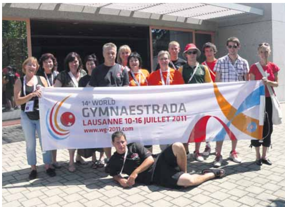
Une partie des 110 bénévoles d'Ecublens.

semaine et ont fait en sorte que tout se déroule parfaitement de façon à assurer le bien-être quotidien, tant des gymnastes que des volontaires. Si à la fin de la semaine elles montraient quelques signes de fatigue, elles n'ont jamais perdu leur sourire et leur bonne humeur. MERCI Mesdames.