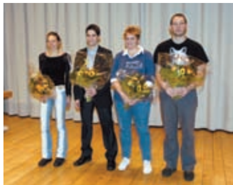
Les lauréats de la Municipalité.

Lundi 28 janvier, les autorités municipales, les représentants du Conseil communal, les responsables de l'USL et des différents clubs et sociétés d'Ecublens se sont donné rendez-vous à la Grande Salle du Motty pour honorer leurs Méritants 2007.