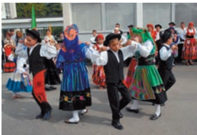
Le Grupo Folclórico Os Minhotos lors de la fête interculturelle du 2 septembre 2007.

Elle coordonne les actions communales en matière d'intégration. Elle est le répondant de la Commission cantonale, ainsi que des autres Commissions communales établies sur le Canton.»