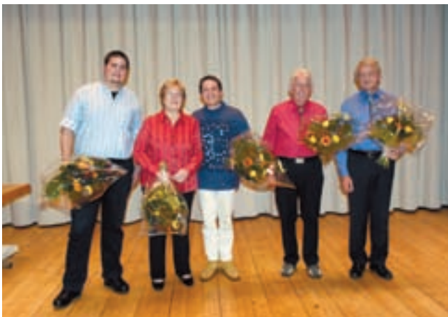
Les lauréats de l'USL.

La seconde partie de la soirée a vu la remise des mérites décernés par l'USL.