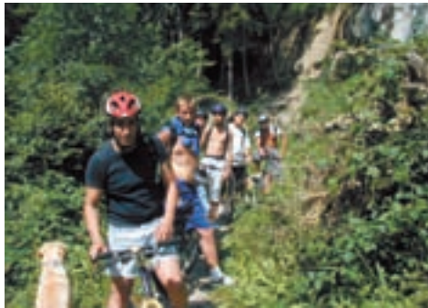
Sortie VTT, un samedi avec le groupe Evasion's.

Le groupe Evasion's: Une fois par mois les jeunes, accompagnés des éducateurs, quittent la ville d'Ecublens pour effectuer