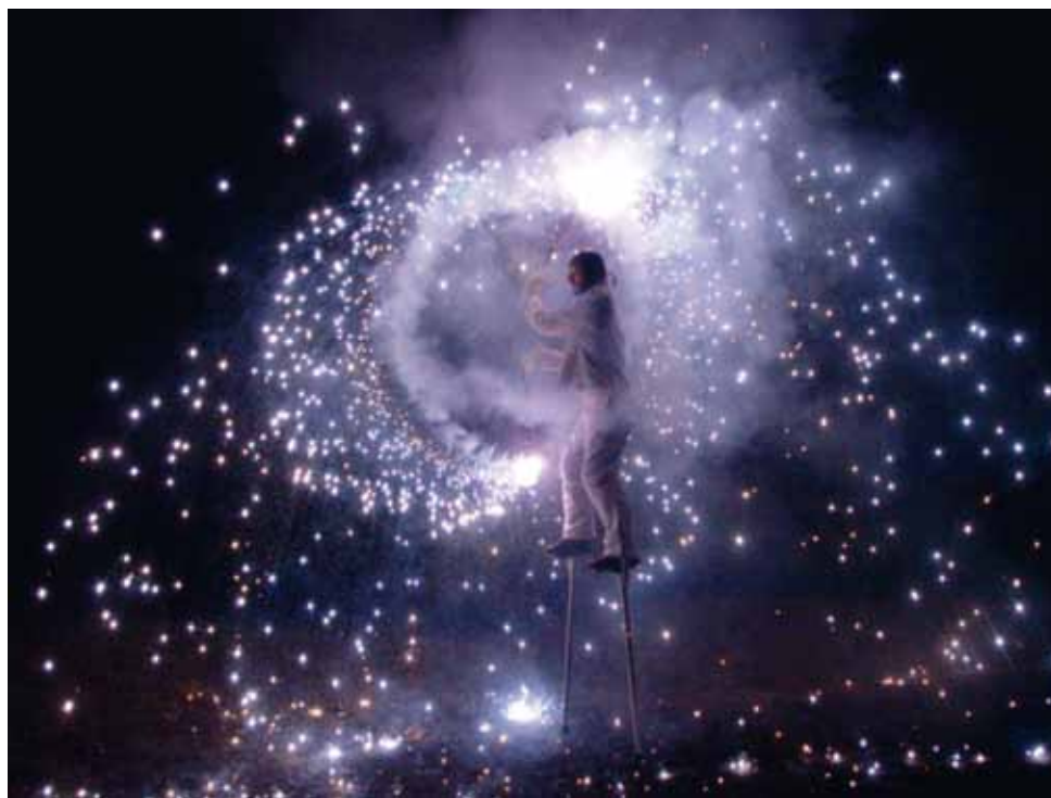
Les Lutins Réfractaires

Pour sa première édition, le festival Equi-no'X a le plaisir de pouvoir offrir au public un programme à la fois original, inventif et festif.