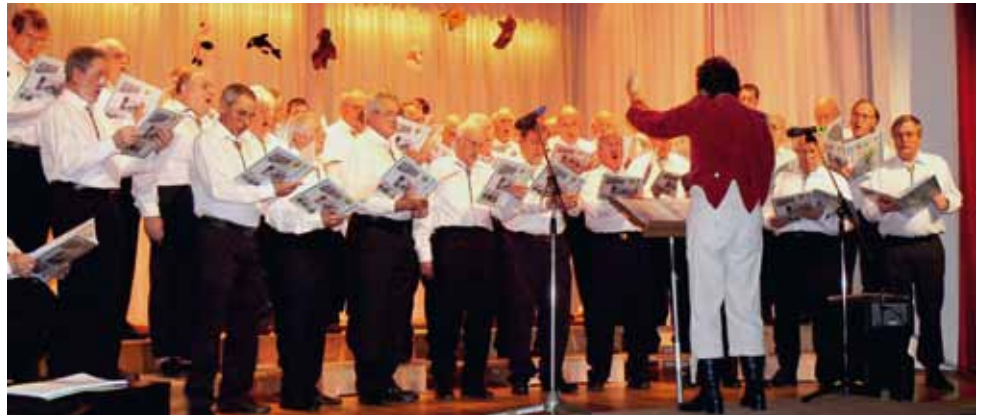
Le chœur d'hommes fort d'une quarantaine de chanteurs

Une quinzaine de chants évoquant du plus petit animal, la fourmi, au plus grand mammifère, la baleine, a émerveillé l'assemblée. Un public venu nombreux a aussi pu applaudir, et parfois bisser, des solistes et un octuor issus des membres de la société. Le sketch réunissant le Syndic, le régent et le caviste et retraçant avec humour l'actua-