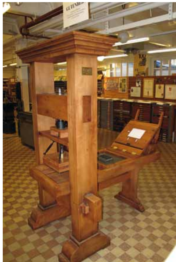
La réplique de la presse Gutenberg

Toutes les machines sont en état de marche, c'est une vraie imprimerie typographique qui est présentée aux visiteurs. La composition manuelle, la composition mécanique, au moyen de Linotype entre autres, l'impression sur une dizaine de machines différentes et la finition de l'objet imprimé par les relieurs sont expliqués. Les visiteurs peuvent même exercer leur talent s'ils le souhaitent. Un film sur la communication de Lascaux à la fin du XX e siècle précède la visite et introduit l'histoire de l'imprimerie.