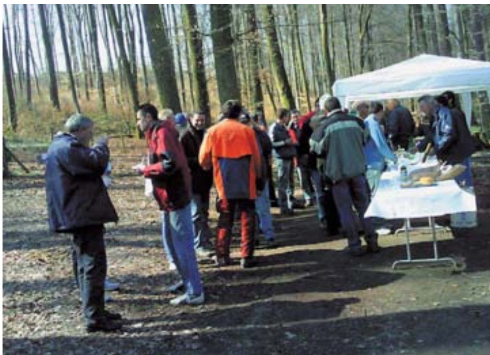
Après les affaires, le réconfort