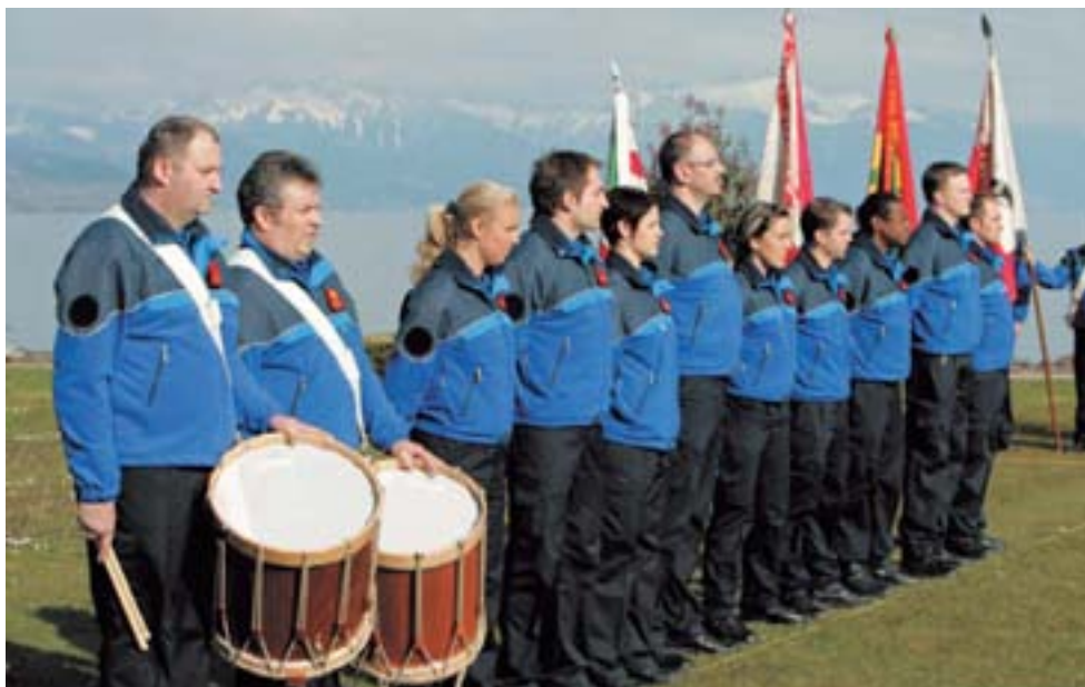
Cérémonie d'assermentation le 16 avril 2008 à Saint-Sulpice

identique sur toutes les communes car les autorisations d'exercer n'étaient pas équivalentes. Le Conseil d'Etat a heureusement accepté le 27 février 2008 d'octroyer des compétences supplémentaires aux policiers avec effet au 1 er mars 2008.