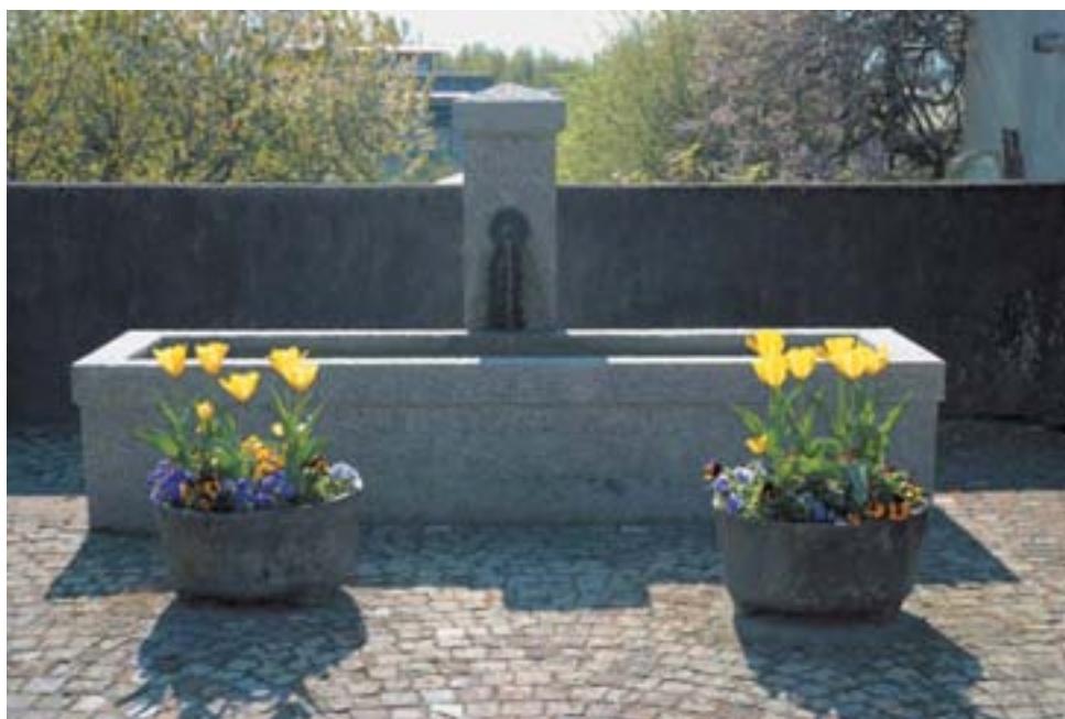
Fontaine de Bassenges