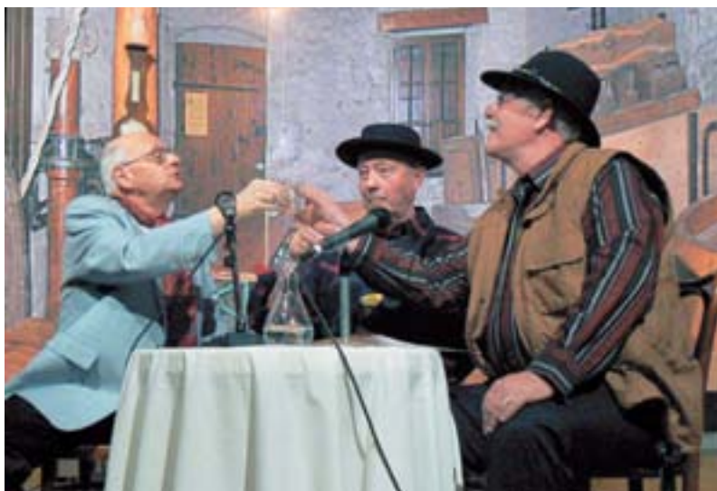
Le régent, le caviste et le syndic au pressoir