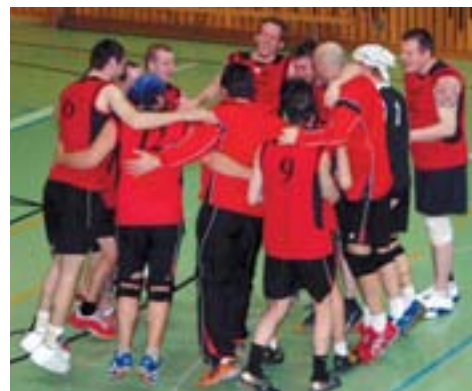
Et que la fête commence...

Une belle cerise sur le gâteau du 30 e anniversaire!