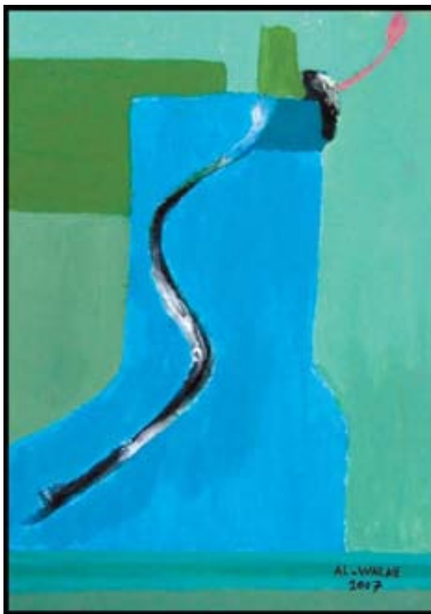
Un tableau peint par Majed Al Wailaie

Le samedi 21 juin prochain, pour la journée mondiale du réfugié, l'atelier vous ouvrira ses portes dès 10h, à la rue Centrale 6 à Chavannes-Renens pour son exposition de peinture.