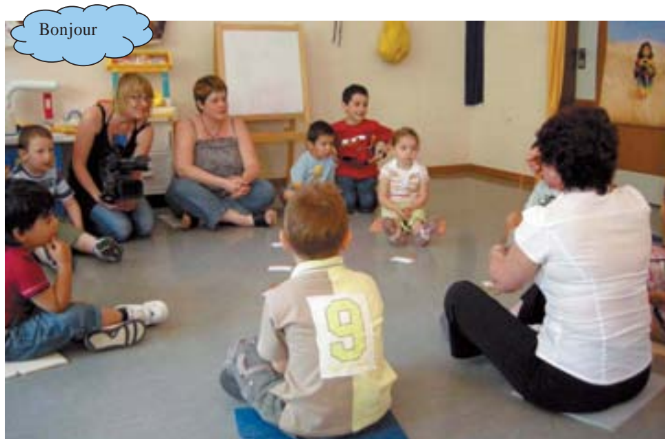
La cérémonie d'accueil

Le mercredi 14 mai dernier, les petits élèves de Piccolo Voice ont attiré l'attention des médias. Pas du tout impressionnés par les caméras, micros et visiteurs ils ont participé avec enthousiasme à leur 6 e cours Piccolo Voice qui a lieu dans le réfectoire des écoles au Pontet.