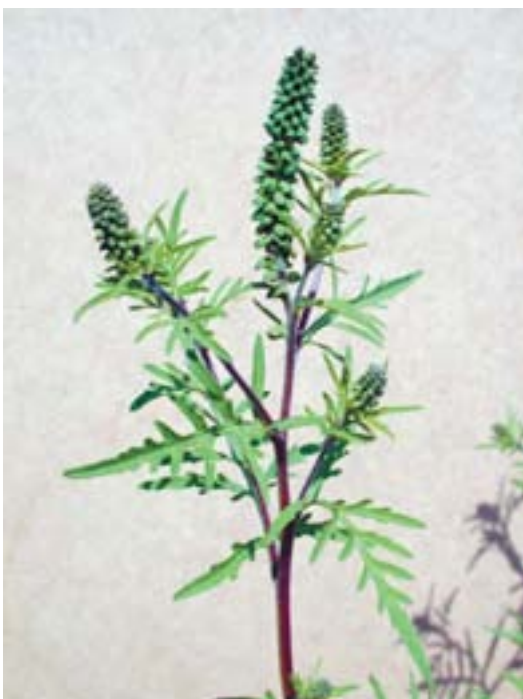
En fleur à Buchillon

Christophe Kündig, Station de Protection des Plantes.