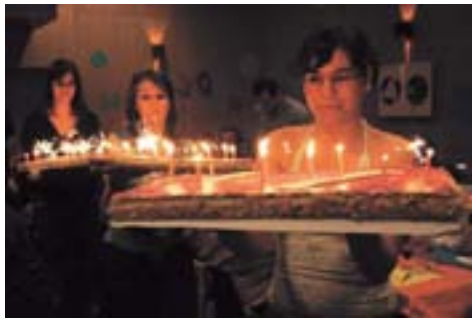
La jeunesse apporte le gâteau aux 30 bougies

La Genèse rappellera que le volley a pu se pratiquer à Ecublens grâce à la bienveillance de sa société de gymnastique, dont le club fut longtemps une sous-section pour pouvoir bénéficier de sa magnifique salle de Pluton, l'Exode la conduisant même à la Planta pour sa 1 re année de ligue nationale, avant de jouer au Croset dès l'automne 1983.