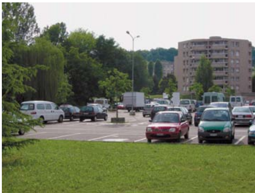
La parcelle où est prévu le futur centre socioculturel

approuvée par votre Conseil communal en novembre 2007. La parcelle communale n° 115, située au sud du Centre commercial, est prévue pour accueillir cette réalisation. Actuellement occupée par un parking, ce dernier sera déplacé dans un parking souterrain à créer par le propriétaire du Centre communal. Lancé au début 2008, le concours d'architecture est actuellement en cours pour l'étude de ce centre. 20 bureaux d'architecture y participent, parmi eux un bureau de Milan. Fin mai 2008, les projets seront remis au jury, qui se réunira en juin pour choisir le lauréat. Début juillet, une exposition publique de tous les projets rendus se tiendra en un lieu qui reste encore à définir. Puis auront lieu l'étude d'avant-projet, son approbation et l'adoption du crédit de construction par le Conseil communal. Mise à l'enquête prévue en 2009 et, si tout se passe comme prévu, début des travaux en 2010, pour s'achever en 2011.