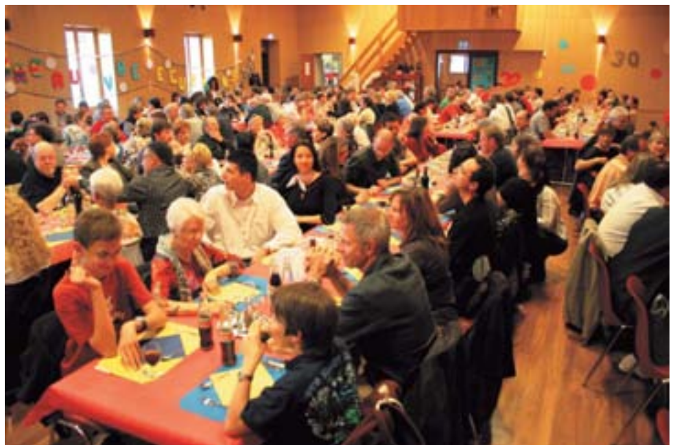
Une salle comble dans une ambiance conviviale

Plus tard, il y eut une courte année en LNB en 89-90, davantage pour le plaisir que pour la performance. Puis la fameuse saison 2002-2003, pendant laquelle Ecublens connut la LNA et ses matches emplis de passion, matches lors desquels le Croset vit l'équipe tutoyer les meilleurs, tels LUC I, Naefels ou Appenzeller Bären. Plaisir et fierté tout de même d'avoir pu jouer si haut, malgré des moyens modestes.