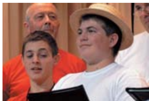
Des jeunes parmi le chœur d'hommes

Pour la première fois, les membres de la société ont assuré l'entier des deux parties du programme. Ils ont enchanté un nombreux public durant trois heures de spec-