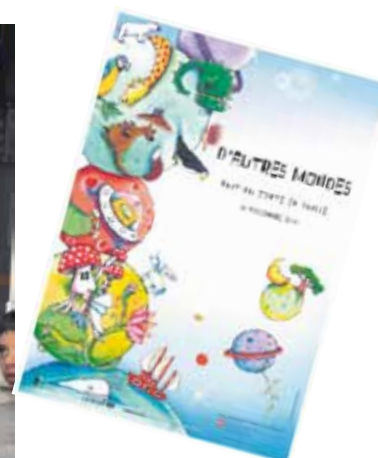
Les enfants sont attentifs (les dessins du concours en arrière-plan).

Pour la 21 e année en Suisse et pour la 4 e fois à Ecublens, la nuit du conte a émerveillé un public nombreux le 11 novembre dernier.