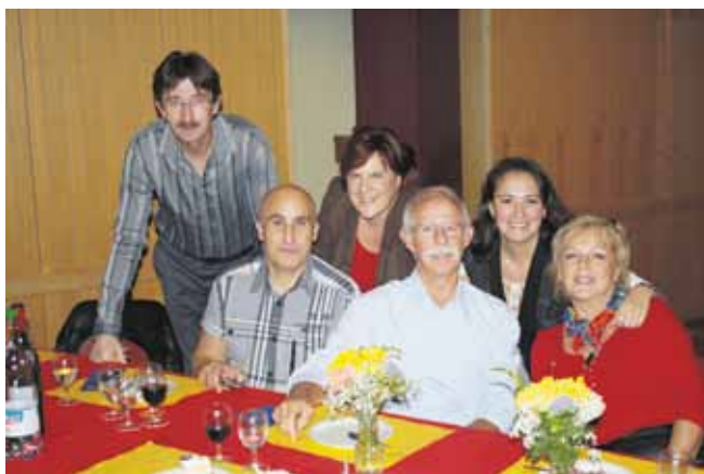
L'équipe de service (merci au comité de l'USL).