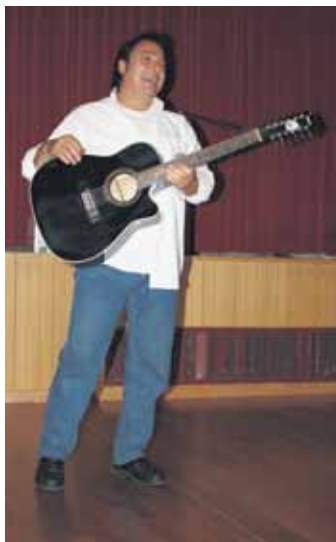
Une surprise musicale offerte par un nouveau bourgeois.

Le 7 novembre dernier, la Municipalité a convié ses nouveaux bourgeois et ses jeunes ayant atteint leur majorité à sa traditionnelle soirée.