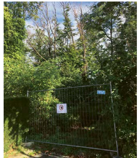
Fermeture du sentier piéton à cause des risques de chute d'arbres.

Yves Kazemi, inspecteur des forêts, DGE-Forêt, tél. 076 362 11 84