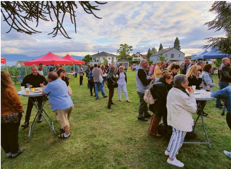
Garden-party de remerciement pour les bénévoles de la Ville d'Ecublens