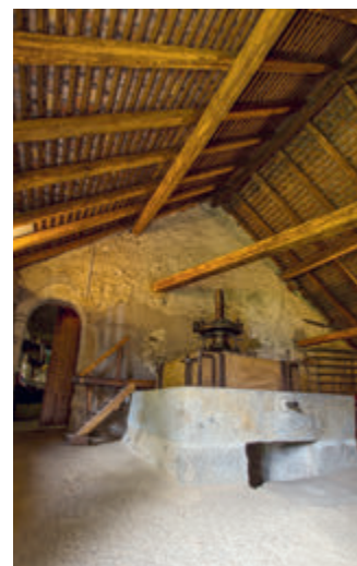
Hangar du Four.