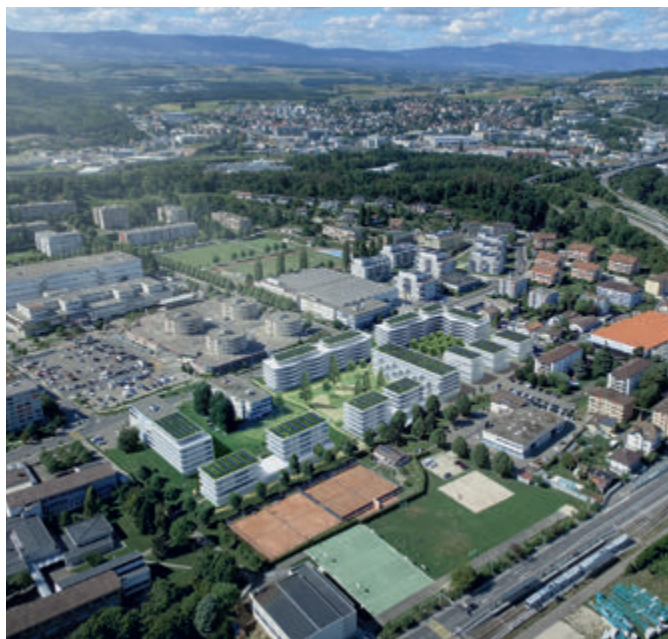
Quartier « En Mapraz ».

Le préavis visait à modifier le Règlement intercommunal sur la taxe de séjour, laquelle est perçue dans le cadre de l'entente communale regroupant les communes de Lausanne, Bussigny, Chavannes-près-Renens, Crissier, Ecublens, Lutry, Pully, Romanel et St-Sulpice. Les modifications permettront notamment au Fonds pour l'équipement touristique de la région lausannoise de soutenir l'acquisition et l'accueil de congrès et grandes manifestations à fort impact touristique, ainsi que de disposer