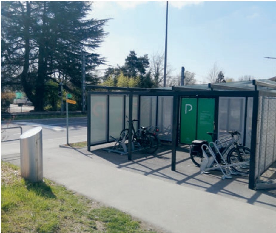
La vélostation du Crochy à Ecublens