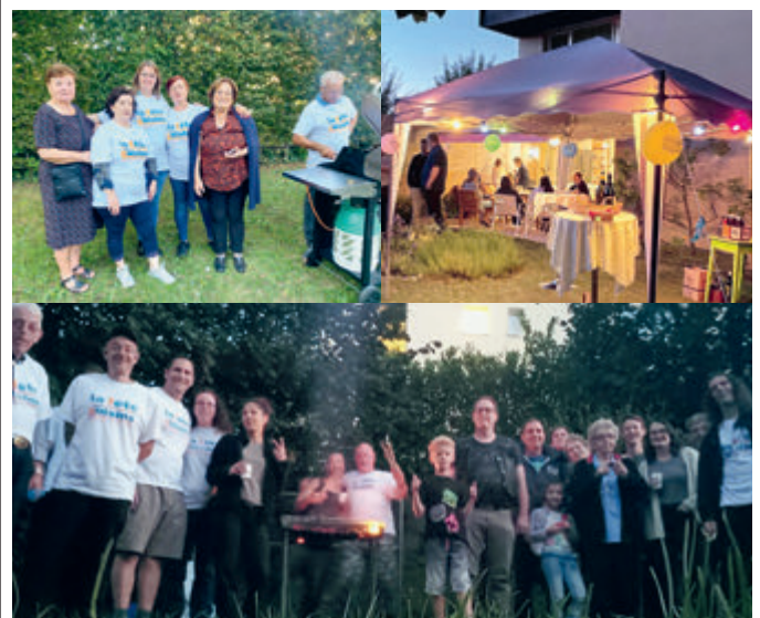
Quartier de Veilloud 52 et 54, chemin des Vignes et quartier d'Epenex.

Un grand merci aux participants qui ont contribué à la vie de leur quartier.