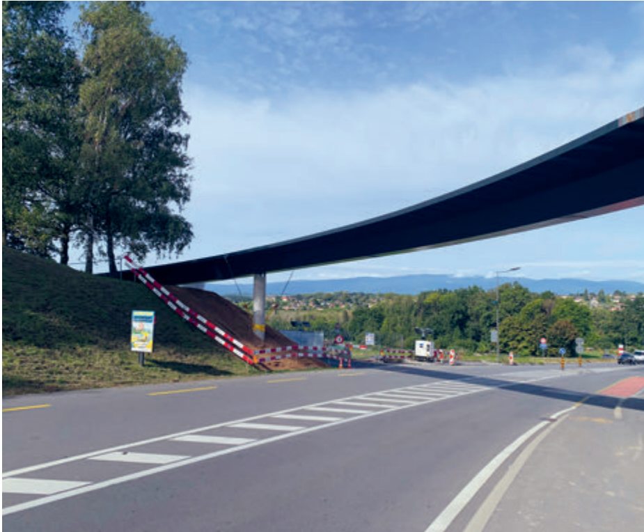
Pose de la passerelle de mobilité douce sur la route de la Pierre