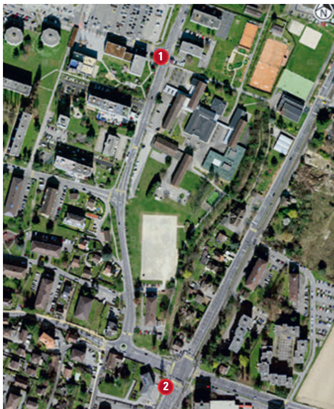
Carte des emplacements des pompes.

L'autre station de gonflage se trouve au carrefour de la Cerisaie (n° 2), à proximité du couvert à vélos qui accueille notamment le vélo cargo à disposition de la population (carvelo2go), ainsi que de la station « Cerisaie » de vélos en libre-service. Ce carrefour stratégique voit passer un nombre important de cyclistes, qui empruntent l'avenue du Tir-Fédéral ou la rue du Villars. Ces deux premières pompes devraient permettre d'améliorer le confort des cyclistes, et d'éviter les désagréments du traditionnel pneu à plat.