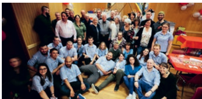
Les membres de la Jeunesse actuelle et quelques anciens.

Un moment intense en présence d'amis, de la famille et d'anciens membres de la Jeunesse. Retour en image sur cet évènement.