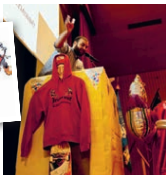
Discours du Président.