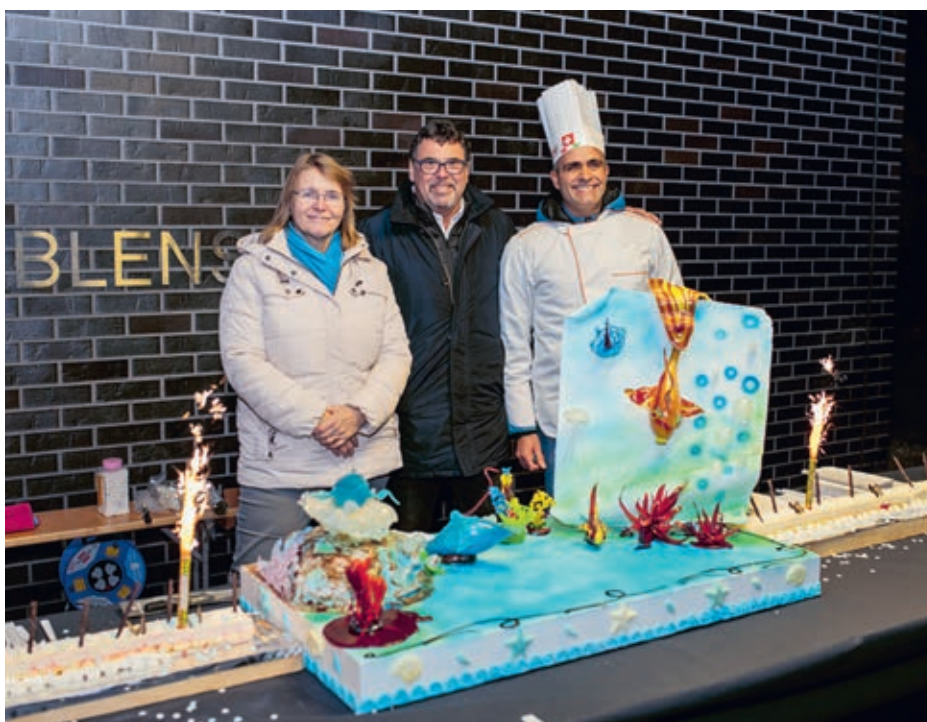
Une panna cotta géante à Ecublens