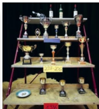
Une partie du musée.

Pour plus d'informations, vous pouvez aller sur notre page Facebook « Jeunesse d'Ecublens-Chavannes » ou nous contacter par e-mail à ecublens.chavannes@gmail.com ou par téléphone au 079 684 59 07.