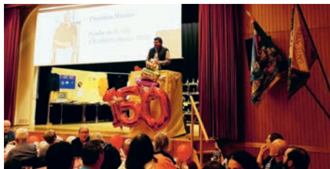
Discours du Syndic.

Voilà plus de 150 ans que la Jeunesse d'Ecublens-Chavannes existe. Afin de fêter dignement ce jubilé, les membres ont organisé une très belle soirée le 9 novembre dernier. Au programme, repas, diverses animations et musée retraçant toute l'histoire de la Jeunesse.