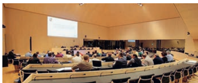
Photos prises lors de la séance du 13 décembre 2019 dans la salle du Grand Conseil.