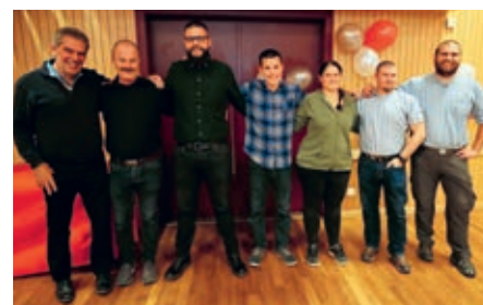
Une partie des anciens Présidents de la Jeunesse.