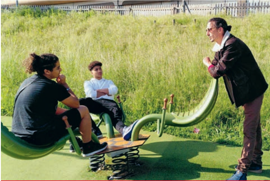
Les employés du Secteur jeunesse d'Ecublens étaient chargés de la prévention auprès des jeunes et de la population en général.