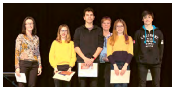
Les gymnastes d'Actigym.