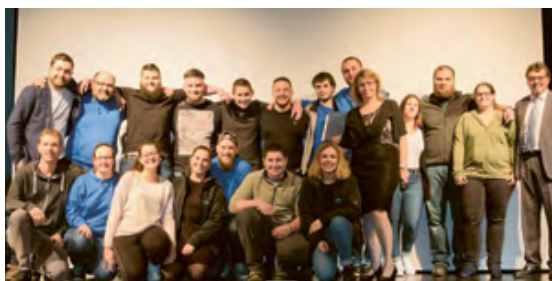
Le comité du Rallye FVJC à SSEC.