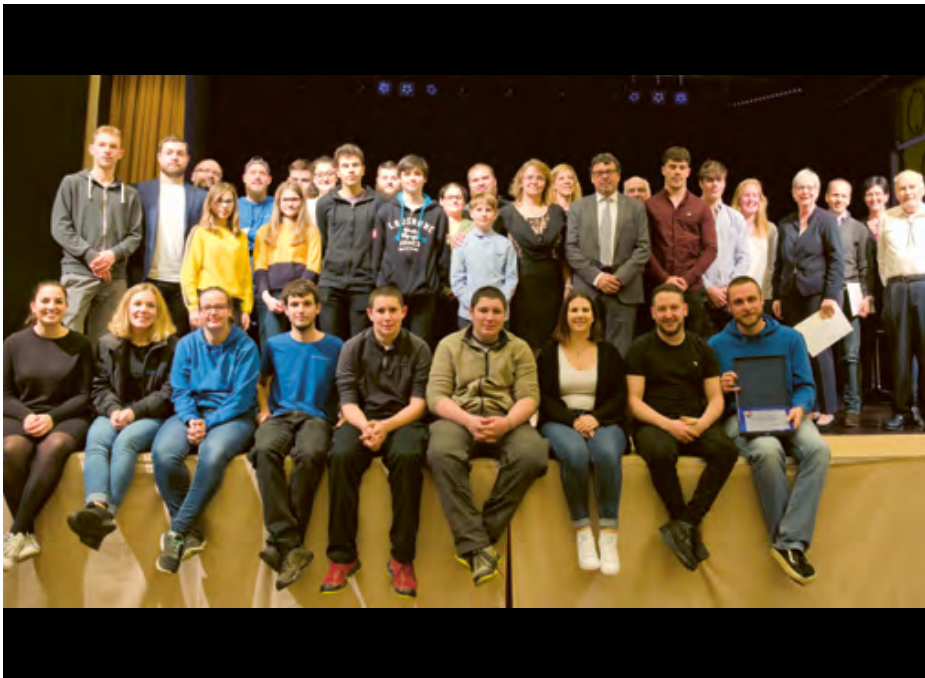
Remise des Mérites 2019: Les récipiendaires de l'USL et de la Municipalité