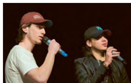
Les rappeurs du Centre de jeunes d'Ecublens.