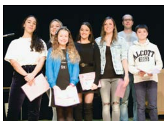
Réceptiendaires du FSG Actigym