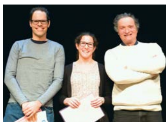
Réceptiendaires du Rushteam