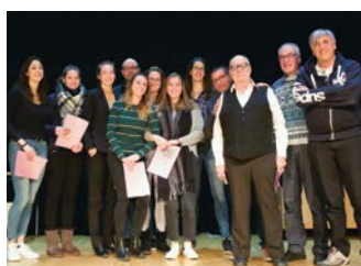
Réceptiendaires du Volley-ball Club