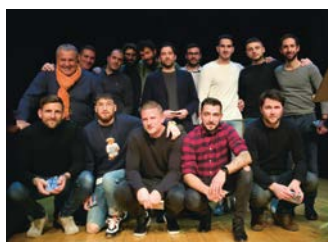
Réceptiendaires du Football Club