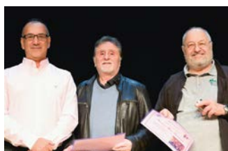
Réceptiendaires du Billards Club de l'Ouest lausannois-Ecublens