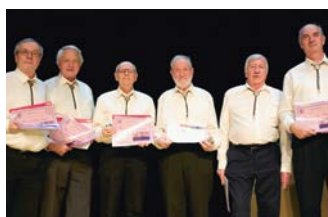
Réceptiendaires de l'Echo des Campagnes