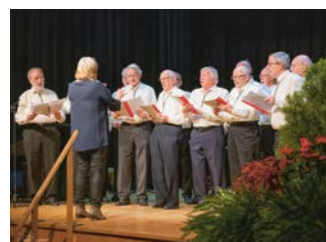
L'Echo des Campagnes