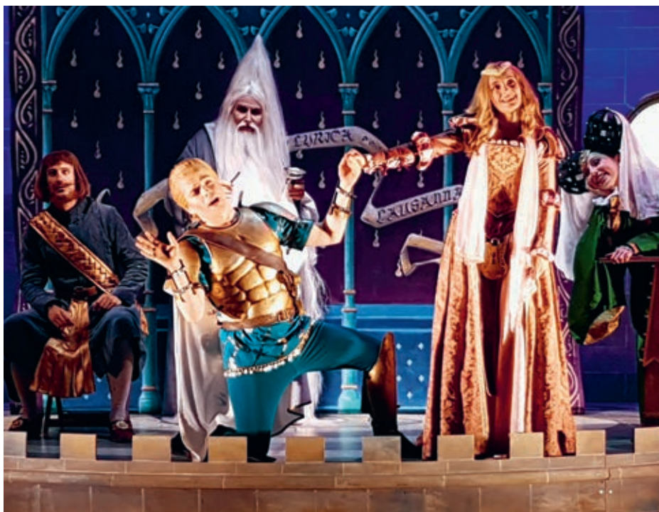
Succès pour la première édition de La Route Lyrique à Ecublens