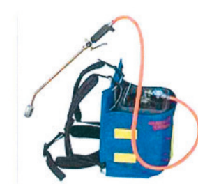
Appareil thermique portable