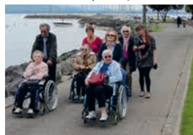
Sortie à Rolle avec les résidents de l'EMS Clair-Soleil

Pour toute question merci d'adresser votre mail à: rotarysaintsulpice@gmail.com Site internet: www.st-sulpice.rotary1990.ch