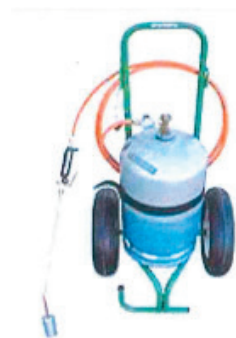
Appareil thermique à roulettes