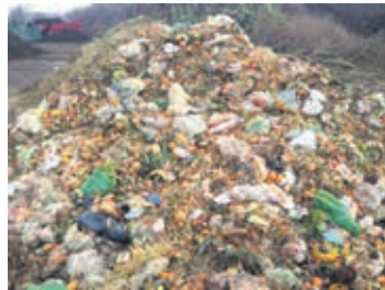
Arrivée d'Ecublens à Lavigny

à la méthanisation industrielle de méthanisation ou de compostage. En tant que consommateurs responsables, nous nous devons de réagir si nous ne voulons pas à l'avenir manger des salades en plastique.