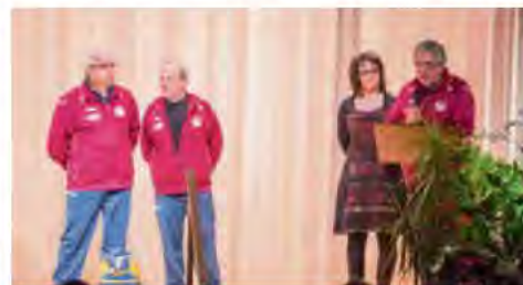
La Boule d'Argent.