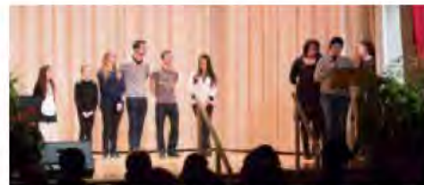
Une partie des récipiendaires d'Actigym.