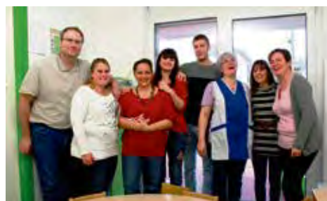
L'équipe presque au complet des Petits Loups.

quelques aménagements, elle devrait être mise à disposition des sociétés dans le courant de ce printemps.