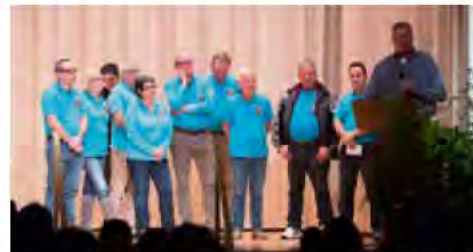
L'équipe de la Pétanque « Le Motty »