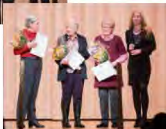
Les 3 bénévoles de la bibliothèque.