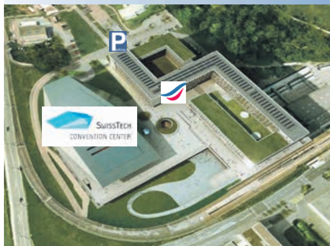
Situation sur le Campus EPFL

Chaque cas, chaque soin, chaque patient est unique ! Nous sommes à votre disposition pour vous informer et fixer ensemble des objectifs de santé bucco-dentaire.