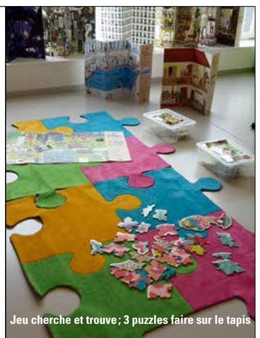
Jeu cherche et trouve ; 3 puzzles faire sur le tapis