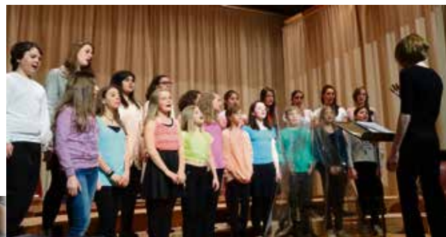
La jeunesse du chœur des Ecoles a enchanté le public.

Le chœur d'hommes Echo des Campagnes a enchanté son fidèle public lors de ses soirées annuelles de fin mars.