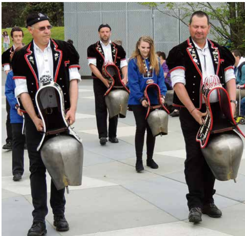
Les sonneurs de cloches de l'Echo des Pâturages en démonstration.

d'identité. Sans oublier la population étrangère, représentant pratiquement la moitié de la population avec laquelle de nombreuses initiatives culturelles ou d'échange sont réalisées par la Commission d'Intégration et d'échanges Suisses Etrangers de la commune.