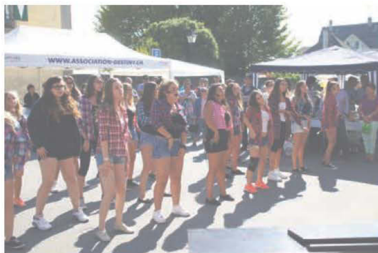
Démonstration du groupe « Chant en mouvement »

La Municipalité d'Ecublens apporte toujours son soutien à cette fête villageoise et les services communaux apportent un soutien logistique précieux.