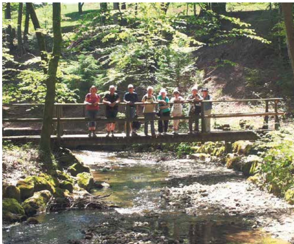
Marche du 10 juin 2014, descente de la Vallée du Flon.

Une nouvelle activité a été proposée en juin aux personnes ayant un rythme de marche lent, ne pouvant suivre les marcheurs du mardi. Une petite équipe s'est retrouvée pour se promener dans la commune l'après-midi et partager ensemble un verre après l'effort. Cette activité a rencontré du succès et va être reconduite en septembre. Contactez-nous si vous êtes intéressés à nous rejoindre pour cette marche.