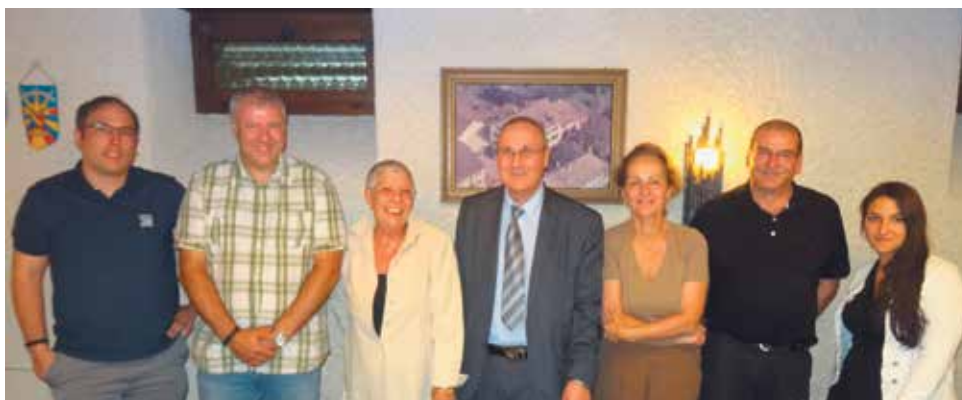
Le nouveau bureau du Conseil est entré en fonction le 1 er juillet

Après avoir fait un apprentissage de conducteur de camion, il a travaillé et conduit des poids lourds dans toute la Suisse et l'Europe. Arrivé à un certain âge,