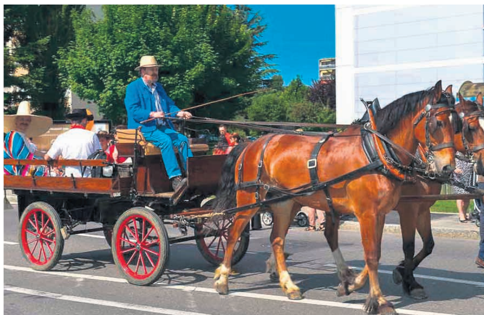
Calèche-balai - infirmerie

Matinée du 5 juillet réunissant tous les acteurs de l'école : Direction - Elèves - Enseignant-e-s - Conseil d'établissement - Personnel du réfectoire - Patrouilleurs scolaires - Polouest - Collaborateurs du Service des bâtiments, sans oublier l'Association Destiny, qui a généreusement mis sa cantine à disposition pour le petit déjeuner servi aux élèves d'enfantine à la 5ème année avant le départ du cortège et dont le bénéfice des ventes de repas et boissons leur a profité.