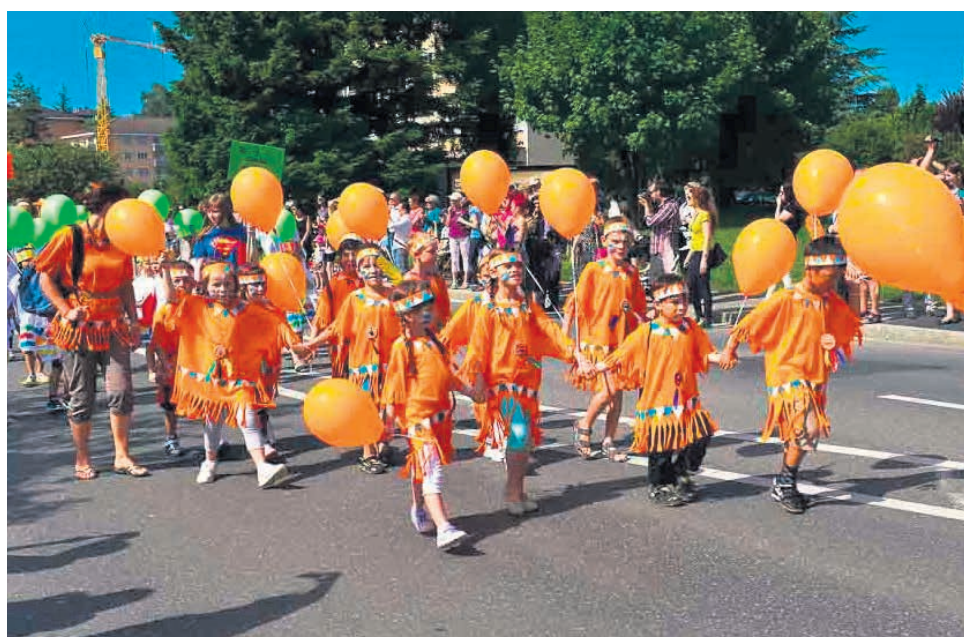
Thème: le Far-West