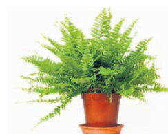
Fougère de Boston