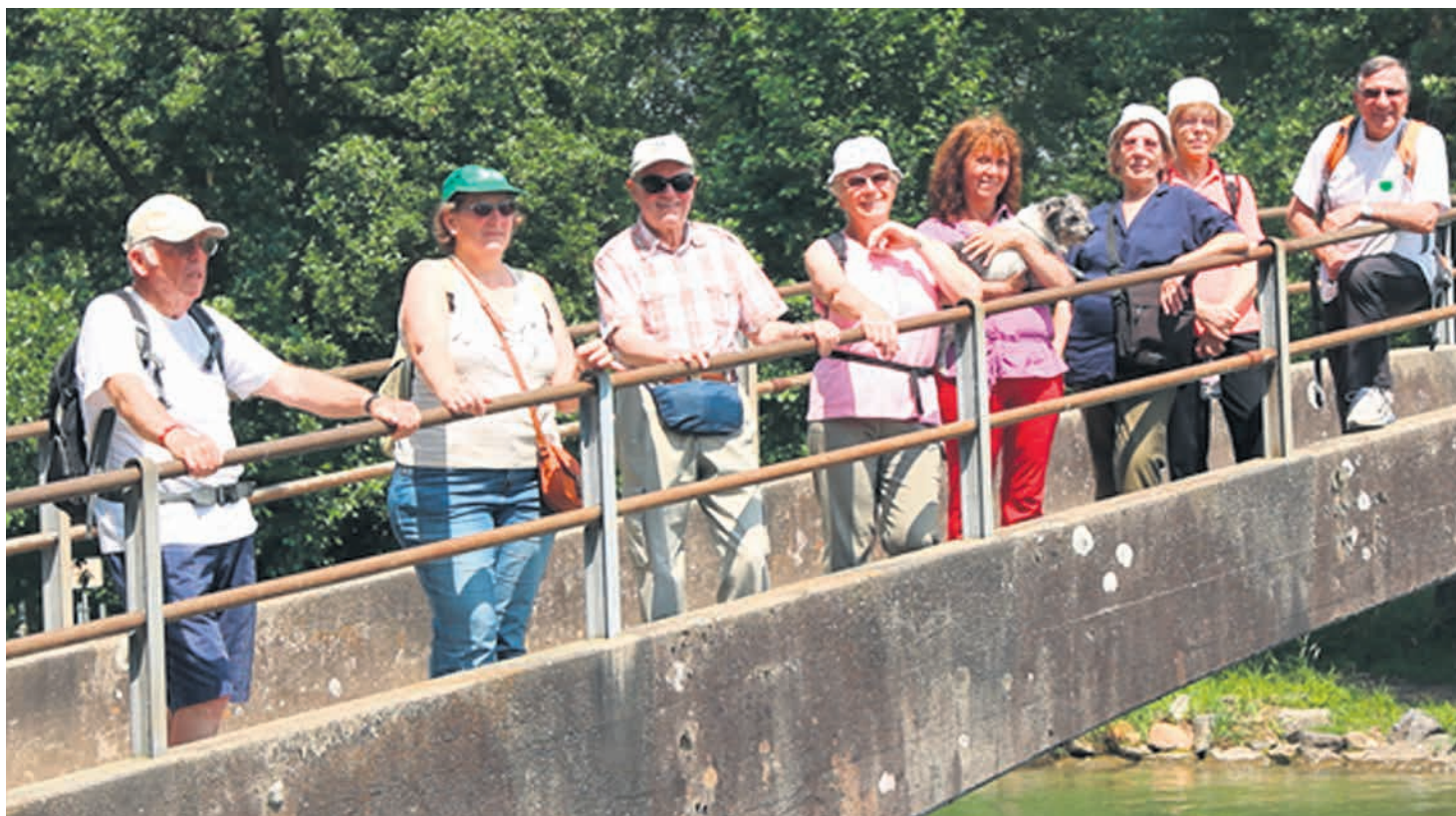
Marche du 9 juillet 2013

Les 55+ d'Ecublens sont heureux de vous parler de leurs activités. Le programme complet peut être obtenu auprès de l'animatrice de proximité de Pro Senectute Vaud ou sur le site internet de la commune d'Ecublens.