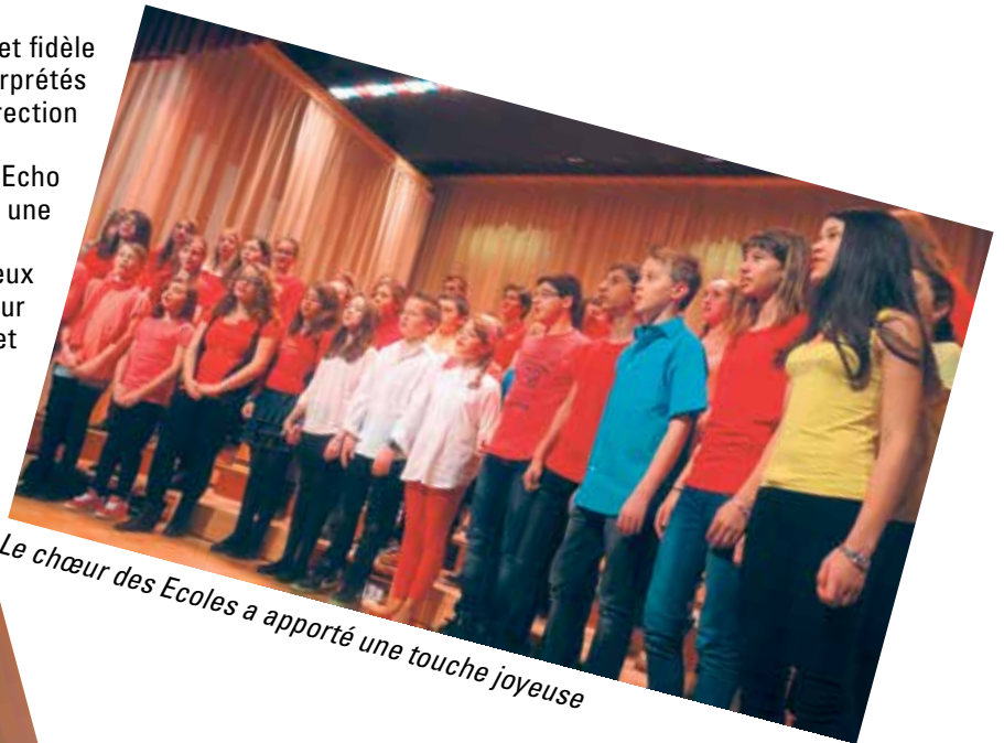
Le chœur des Ecoles a apporté une touche joyeuse