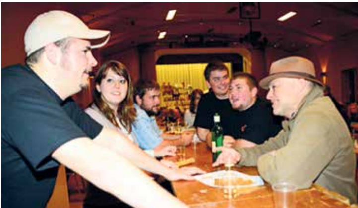
L'atmosphère est conviviale