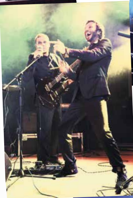
Explosion de caca