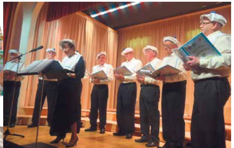
L'octuor nous a emmenés en bateau