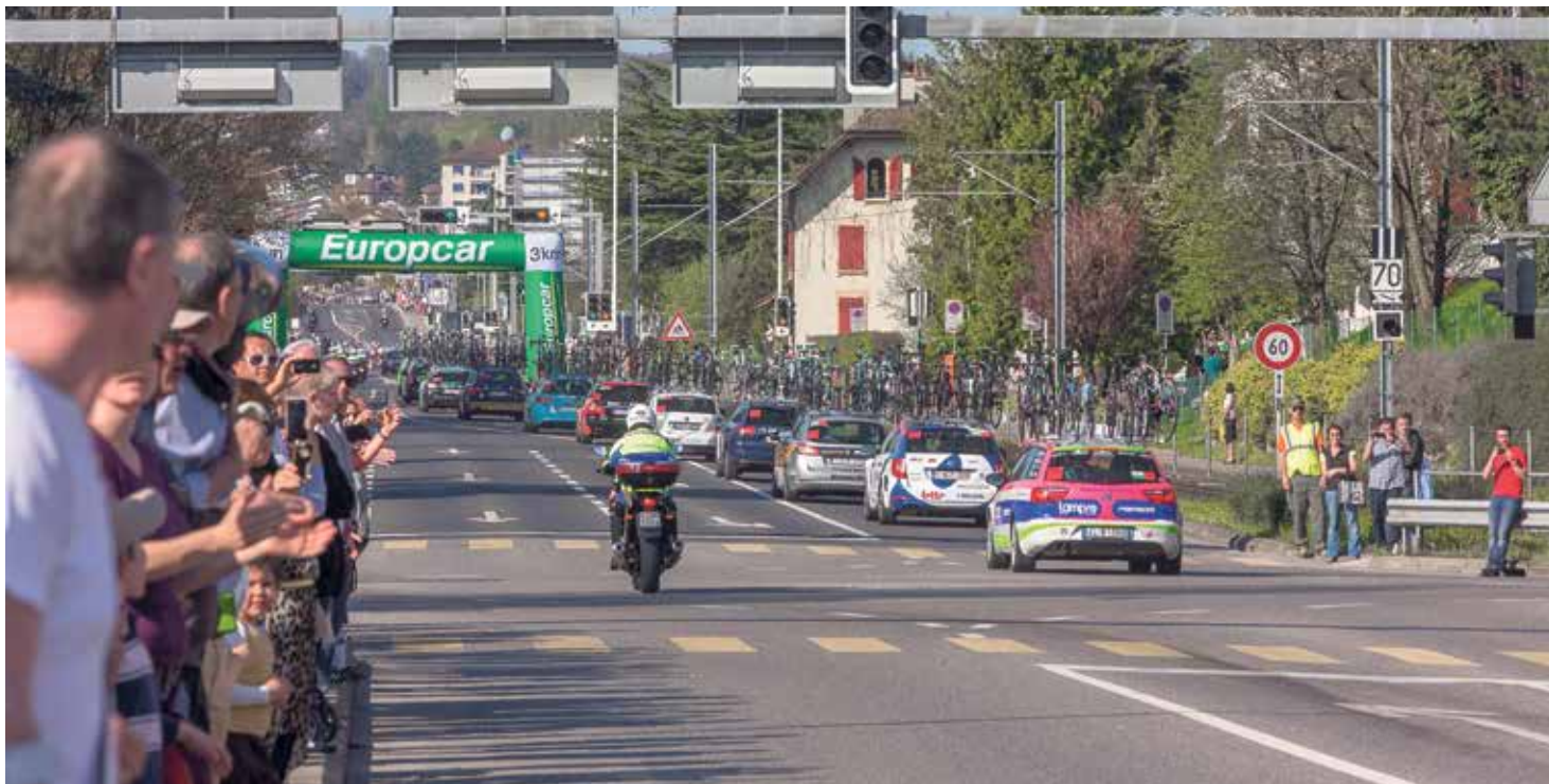
Passage du Tour de Romandie à Ecublens