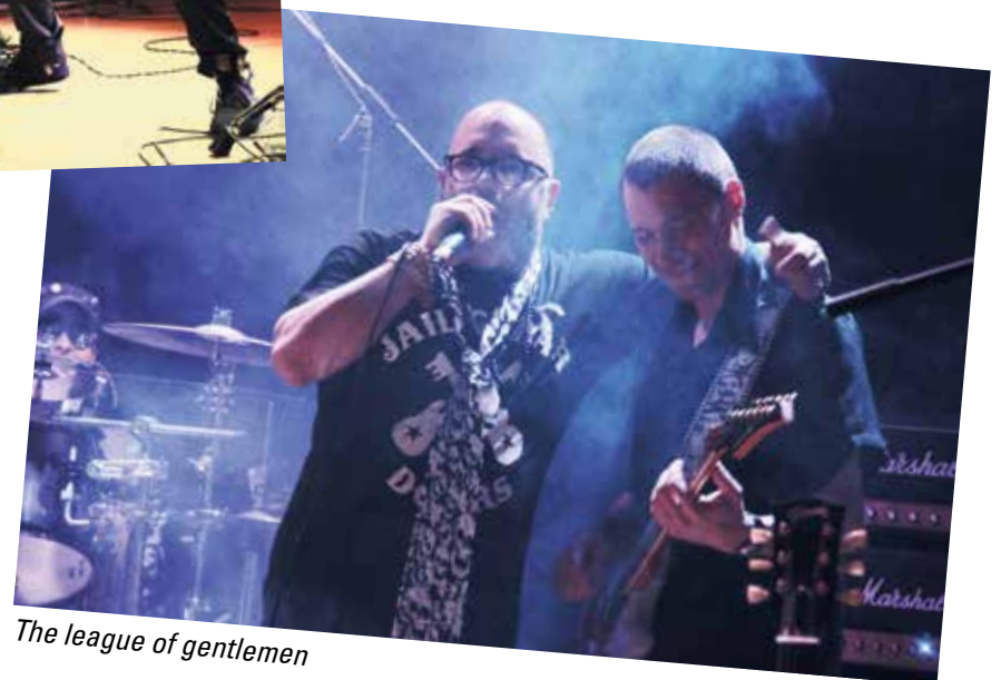
The league of gentlemen