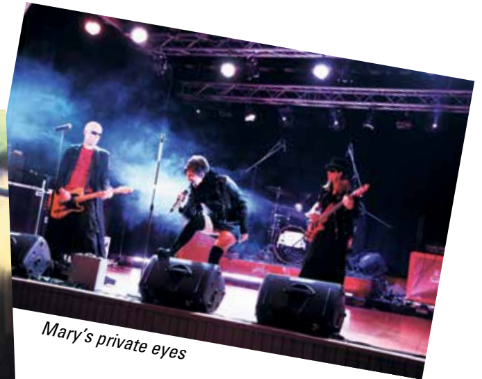
Mary's private eyes

ecublens animation société de développement