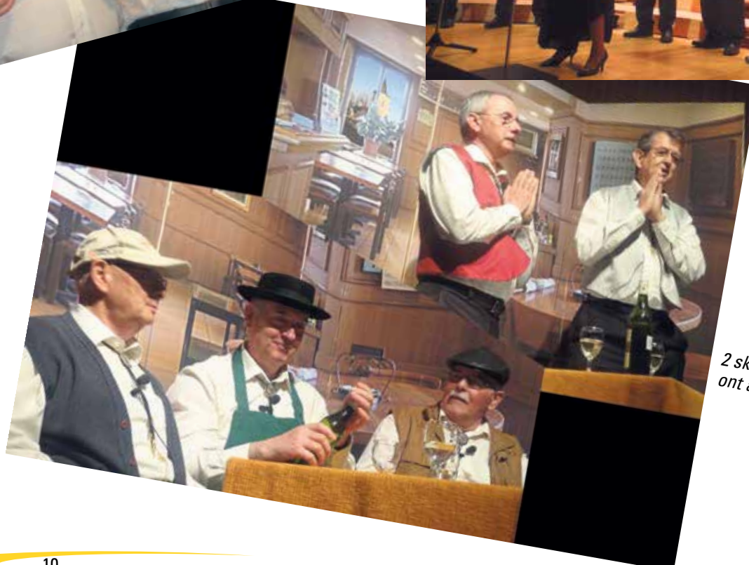
2 sketches de circonstance ont amusé le public