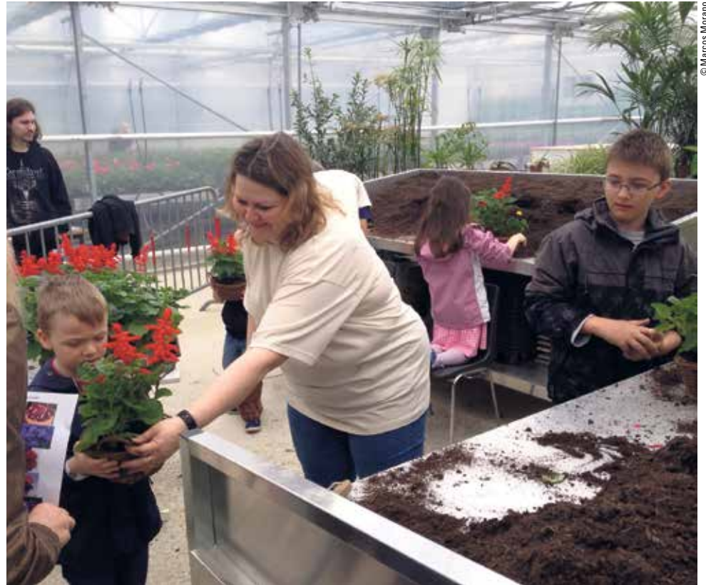
Les enfants confectionnant un arrangement

Samedi 27 avril 2013, a eu lieu l'inauguration des nouvelles serres communales. Environ 200 personnes sont venues rendre visite à nos horticulteurs et voir leur nouvel outil de travail.