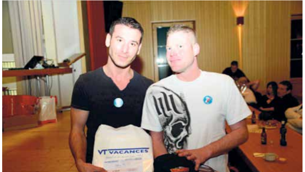
L'équipe gagnante du tournoi