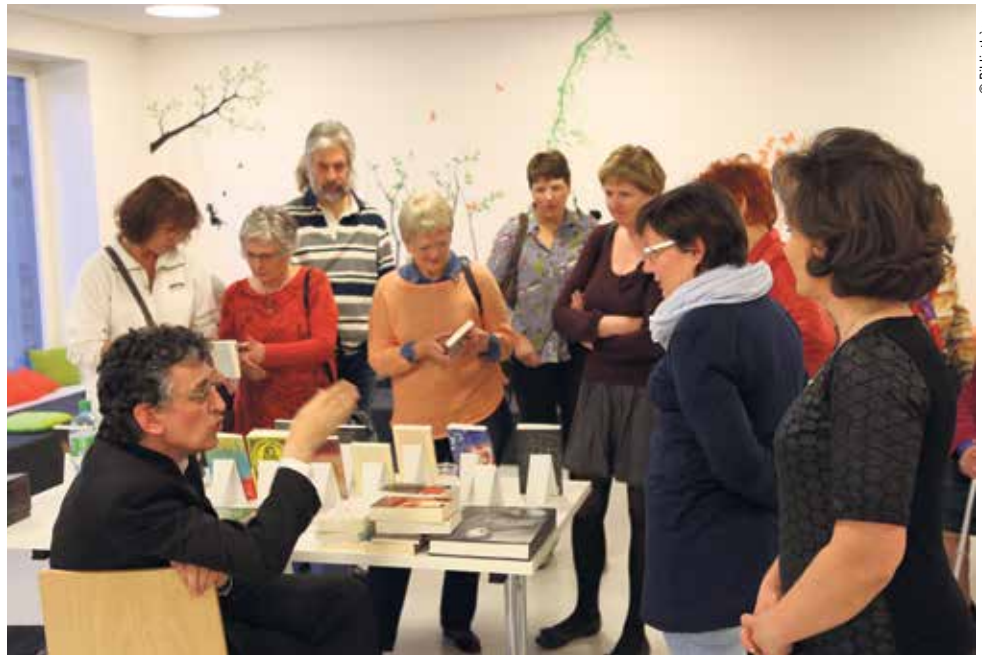
L'assemblée attentive à la conférence de Bernard Campiche

La dernière partie de la soirée s'est déroulée sous forme de questions – réponses. Nos questions tournaient autour des sujets comme le livre électronique, l'avenir du livre en papier, le prix du livre, son marché, etc.