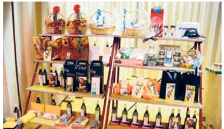
Une belle planche de lots