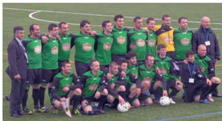
L'équipe du Belmonte Castello