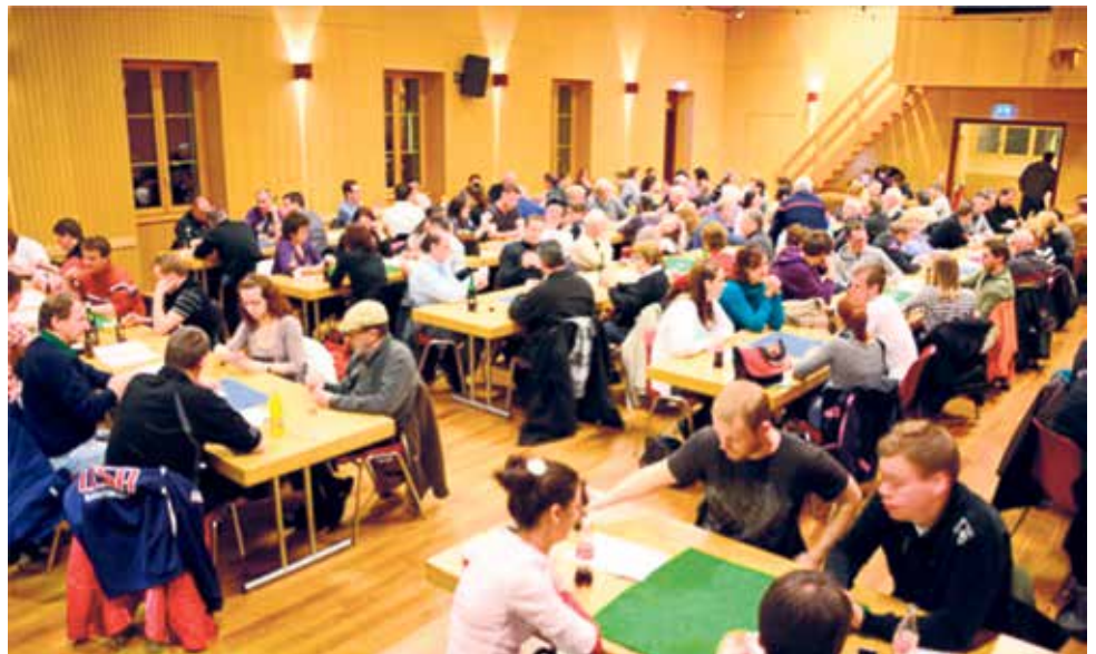
La salle du Motty affiche complet