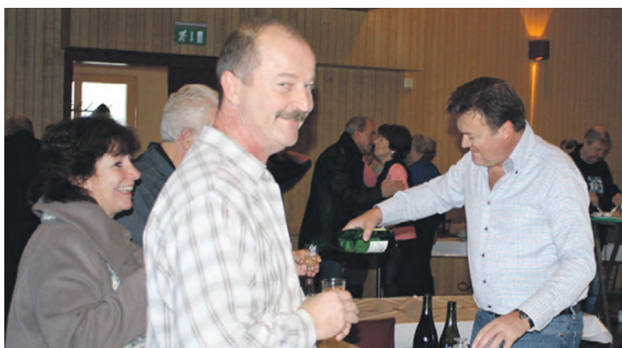
Le Syndic est de la partie