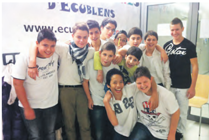
Une partie des jeunes présents