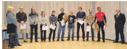
Les athlètes du Rushteam ayant participé à l'IronMan de Frankfort