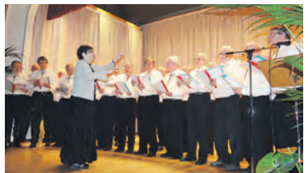
La magnifique prestation chorale du chœur d'hommes Écho des Campagnes

sous les applaudissements nourris de l'assemblée réunie au Motty le 28 janvier dernier.