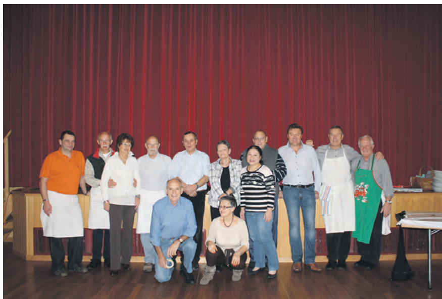
Les 13 bénévoles

Nous saisissons l'occasion pour remercier la Municipalité, Ecublens Animation et les 13 bénévoles sans qui cette manifestation, empreinte d'une très grande convivialité, ne serait guère envisageable.