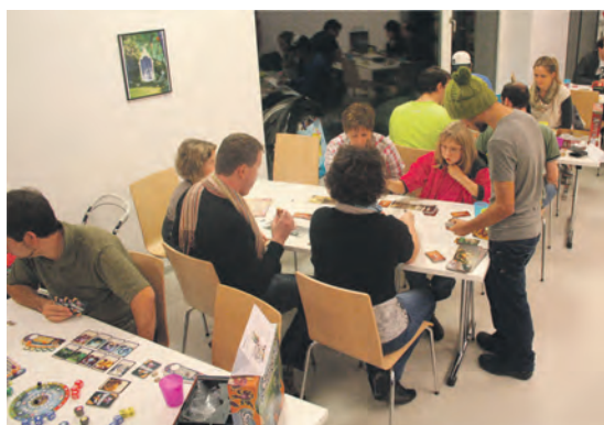
Soirée jeux du 24 novembre 2012

Déjà en 2012, les deux soirées organisées ont attiré un public fidèle. L'année 2013 a commencé sous les meilleurs auspices le 12 janvier avec l'éditeur suisse GameWorks et l'auteur Bruno Cathala. Puis le 9 février c'était au tour de l'éditeur Helvetia Games de venir nous présenter ses produits. La suite de l'année s'annonce toujours passionnante, jugez plutôt :