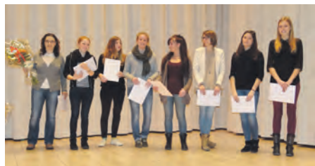
L'équipe du VBC Ecublens F2