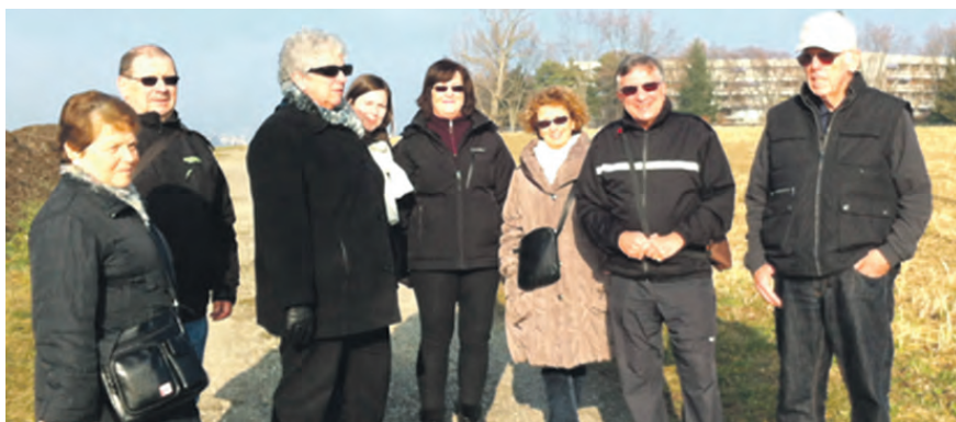
Marche du 8 janvier 2013

A présent, le groupe des 55+ d'Ecublens se penche sur la préparation du prochain forum, qui s'adresse à tous les seniors de la commune, afin de poursuivre ensemble la création de nouvelles activités et la réflexion sur ce qui les concerne!