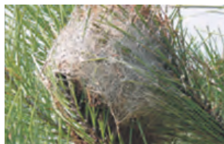
Nid de chenilles processionnaire du Pin