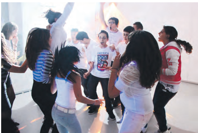
Les jeunes se sont beaucoup amusés en dansant

le fameux tube « Gangnam Style » ou quelques autres moments plus tendres avec les slows. Ce sont 39 jeunes qui ont participé à la soirée, qui fut une belle réussite, pleine de bonne humeur et de sympathie.