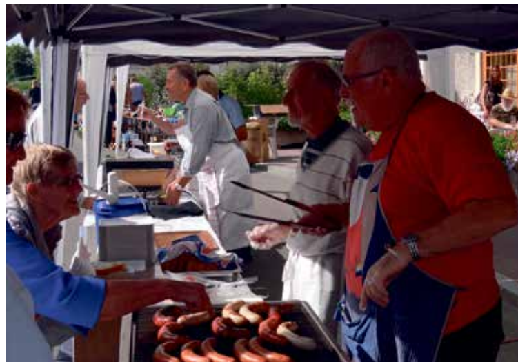
Les saucisses grillées et les raclettes ont rencontré un franc succès