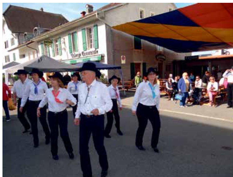
Le groupe de danse Country a animé la fête