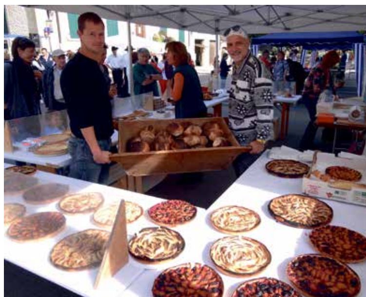
Les pâtisseries maison et le pain de Renges étaient succulents