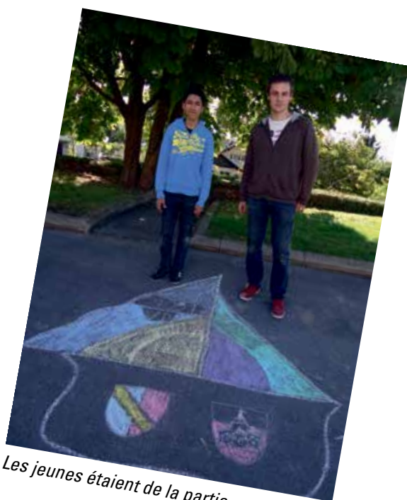
Les jeunes étaient de la partie