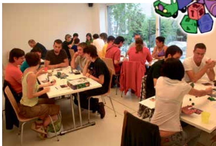
Tournoi du jeu King of Tokyo le 7 septembre

Voilà un peu plus d'une année que la ludothèque Le Dé Blanc a établi ses quartiers au Centre socioculturel. On peut y trouver environ 1300 jeux et jouets pour tous âges et tous types de joueurs. Mais l'endroit se veut plus qu'un simple lieu d'emprunt. Il est possible de jouer sur place pendant les heures d'ouverture (lundis, mercredi et jeudis, de 15h à 18h30) et ainsi de découvrir différentes expériences ludiques. Le Dé