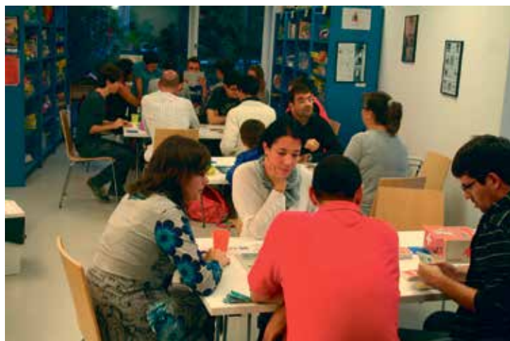
Soirée jeux du 5 octobre