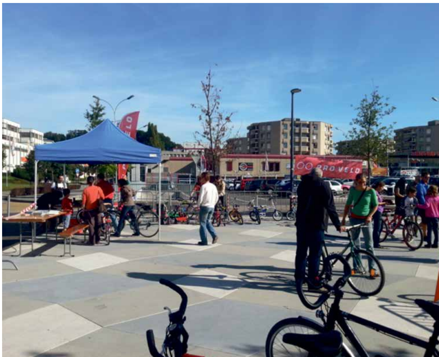
Foire aux vélos (21.09.2013)