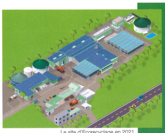
Le site d'Ecorecyclage en 2021

L'usine de Lavigny entame sa dernière phase d'aménagements. Les nouvelles installations permettront d'augmenter la capacité de traitement de la matière organique et d'accroître de manière significative la production de biogaz, grâce à la construction d'un nouveau digesteur liquide.