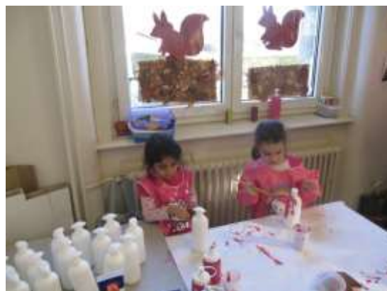
Les élèves de la classe 1-2P/08 en train de préparer les cadeaux de Noël