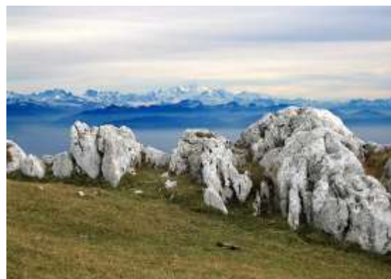
Le Mont Tendre

La 31 e édition de la traversée du Jura , réservée aux classes de 10 e VSB/VSG/VSO, s'est déroulée du 9 au 13 septembre 2013 dans de bonnes conditions. Comme à l'accoutumée, cette semaine de marche a été une totale réussite.