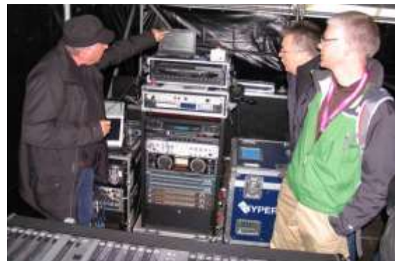
Prises de mesures sur les basses fréquences lors du Festival Balélec à l'EPFL, le 3 mai 2013

En 2013, à Ecublens, le service est intervenu à 2 reprises à la suite d'accidents de la circulation. 70 interventions ont été réalisées sur des chantiers, notamment à l'avenue du Tir-Fédéral et au giratoire des Glycines. Les policiers sont également intervenus lors de 13 manifestations, dont Balélec. Enfin, 74 interventions ont été réalisées pour la pose de compteurs routiers.