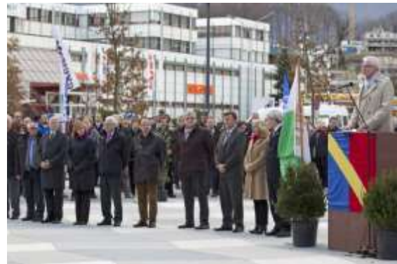
Cérémonie d'assermentation à Ecublens