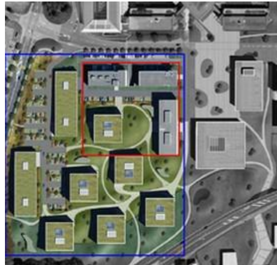
Le Parc Scientifique (en rouge) se trouve au cœur du Quartier de l'Innovation (en bleu) qui héberge sur plus de 55'000 m 2 de bureaux et de laboratoires, de nombreux centres de recherche de sociétés multinationales - outre la centaine de start-up innovantes du PSE.