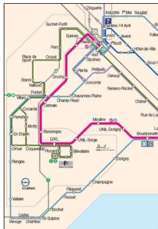
Lignes TL à Ecublens