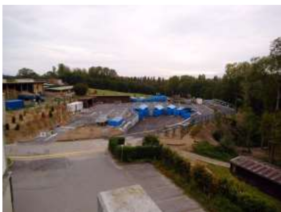
Vue d'ensemble de la déchetterie communale

La Municipalité a accepté que tous les objets décrits ci-dessous, prévus durant l'année comptable 2019, soient traités durant l'automne 2020 par la prochaine Commission de gestion (année comptable 2020), à cause de la crise sanitaire actuelle. La COGES est satisfaite de cette décision/prise de position de la part de la Municipalité.