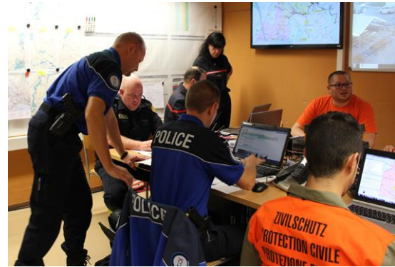
Cap sur l'Ouest, poste de commandement dans les locaux de la PCI à Ecublens

Le 28 septembre 2014 s'est déroulée la Fête du district de l'Ouest lausannois « Cap sur l'Ouest ». A cette occasion, la Police de l'Ouest a collaboré étroitement, avec différents partenaires, notamment la Protection civile de la région, au bon déroulement de cet événement privilégiant la mobilité douce.