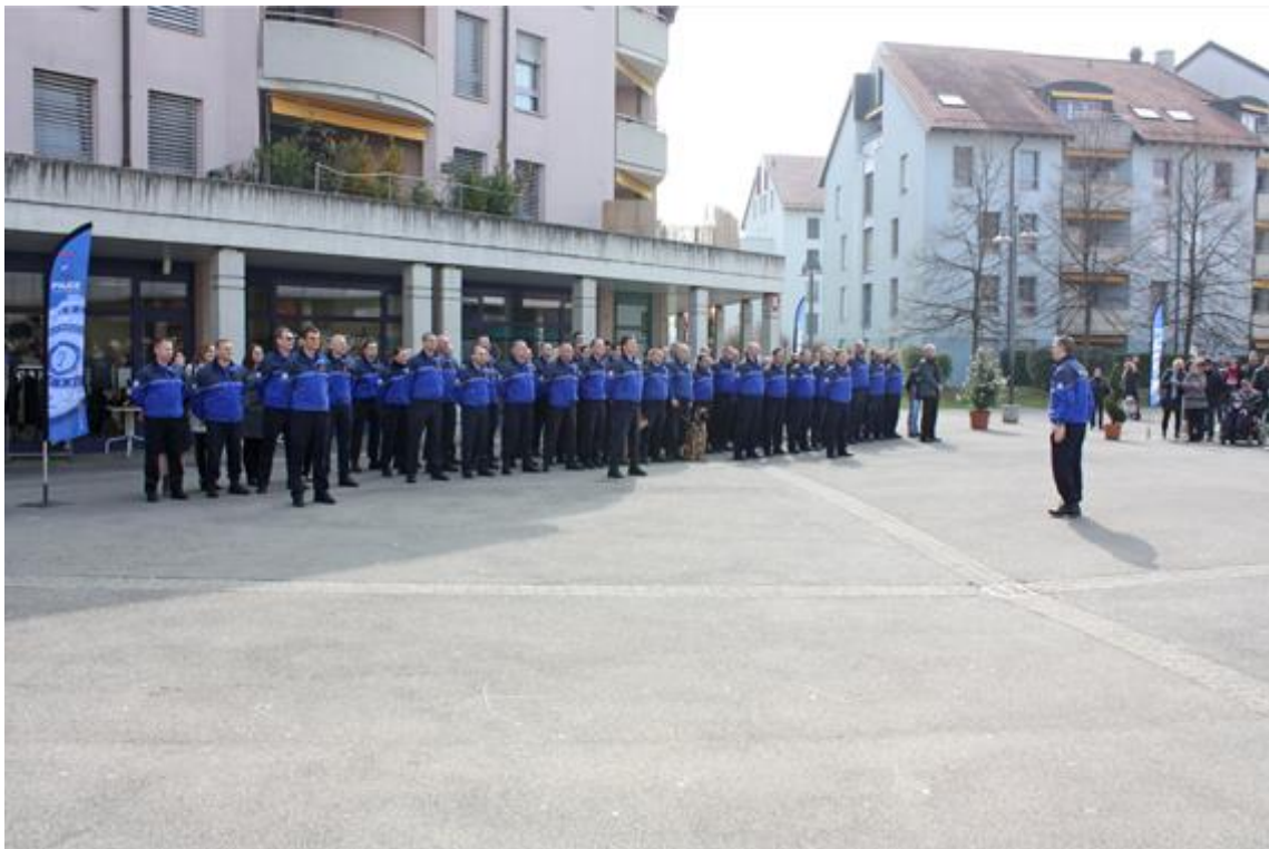
Cérémonie d'assermentation du 27 mars 2014 à Bussigny